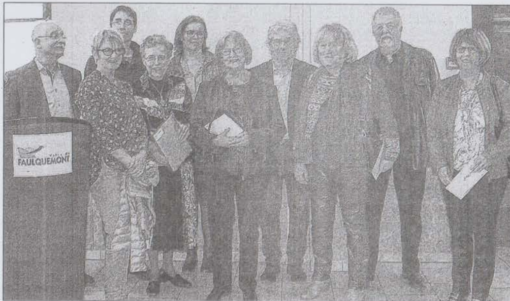
Les œuvres exposées se sont offertes aux yeux des visiteurs... Ici, le Grand prix de la ville.