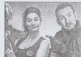
Dans Raid Dingue, Dany Boon et Alice Pol forment un duo de choc.

Dans le cadre du mois du cinéma, en partenariat avec le Centre régional audiovisuel de Lorraine, le gymnase culturel de Faulquemont projette ce mardi 14 mars à 20h, Raid Dingue , un film de Dany Boon, avec Alice Pol, Dany Boon, Michel Blanc.